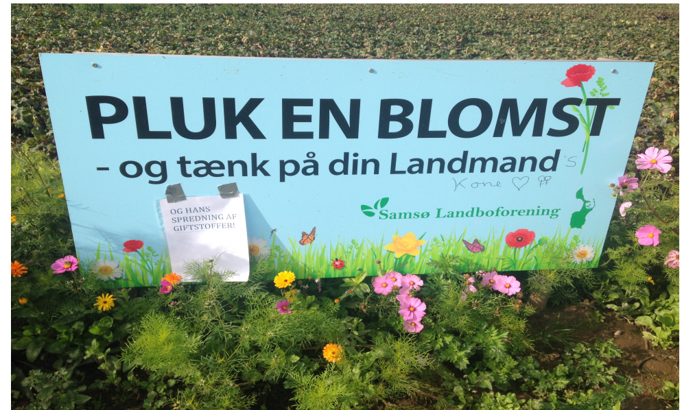
På billedet ses et eksempel på en materialisering af hverdagskampene der finder sted på Samsø

Så når der snakkes om biogas bliver selvforståelsen som et miljøbevidstindivid aktiveret. Selvforståelsen som miljøbevidst betyder dog ikke nødvendigvis at det knytter aktørerne tættere til biogas anlægget. De kampe aktørerne tager i hverdagen kan være en katalysator for at interessere sig for biogasprojektet men for nogle virker biogas projektet stadigvæk langt fra hverdagen. En usynlig aktør forklarer hvordan hendes relation til biogas er: "Biogas vedrøre ikke os, det er til færgen" .