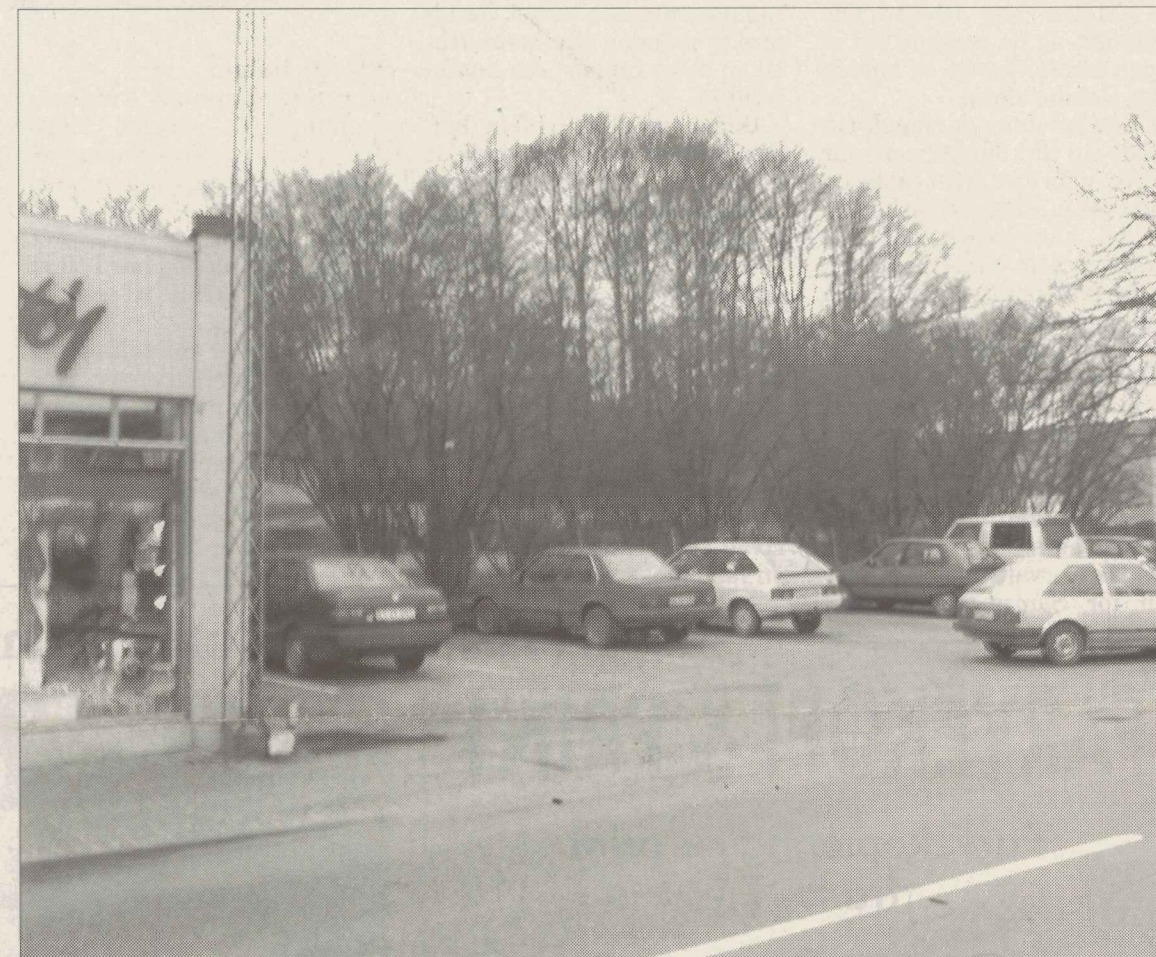
Parkeringspladsen mellem Imenco og Flynchs Hotel, hvor Netto har planer om at bygge.

Hverken ejeren af ejendommen eller Nettos direktør har indtil videre ønsket at udtale sig om planerne for forretningsbygget.