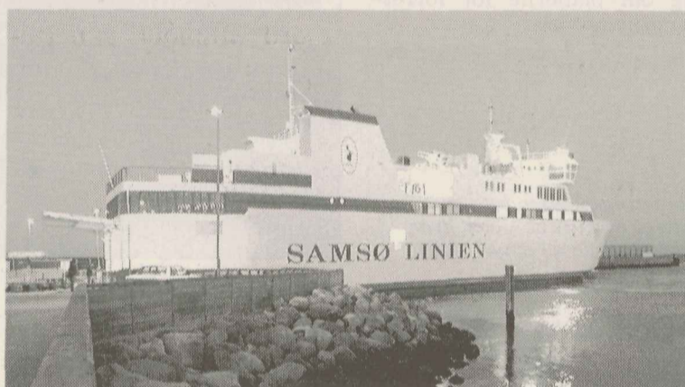
"Kyholm" må blive i Sælvig indtil 1. marts.

SÆLVIG: Ombygningen af færgeløbet til Sjællandsfærgen "Kyholm" bliver 10 dage forsinket på grund af vejret, så færgen først kan flyttes 1. marts mod oprindeligt planlagt 19. februar 1999. Derfor sejler "Kyholm" fortsat til Kalundborg fra havnen i Sælvig til og med 1. marts 1999.