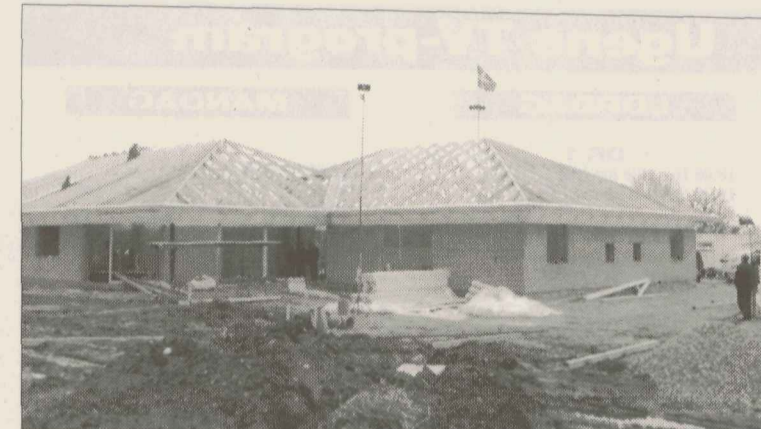
Allerede i maj skal de første beboere kunne flytte ind i bofællesskabet.